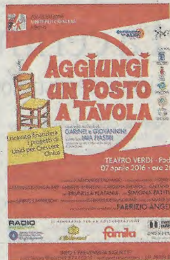
Due scene del musical della compagnia dell'Alba e la locandina del Verdi

paesino di montagna e del suo parroco, che un giorno riceve una telefonata direttamente da Dio: sta per arrivare un nuovo diluvio universale e